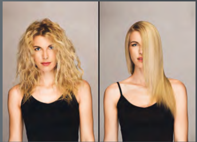
Der Vorher-Nachher-Effekt ist deutlich sicht- und fühlbar

Für optimale Haltbarkeit empfehlen wir unsere hochwertigen Heimbehandlungsprodukte, die dem Haar auch zu Hause Tannin zuführen.